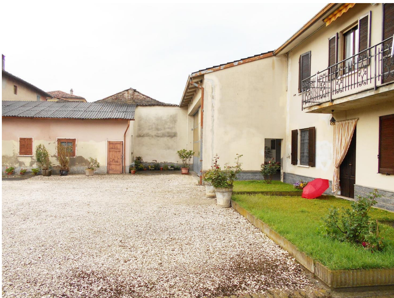
Foto 4 - Veduta dell'angolo nord-ovest con, partendo da destra, l'abitazione, il deposito e porzione del fabbricato accessorio di futura demolizione