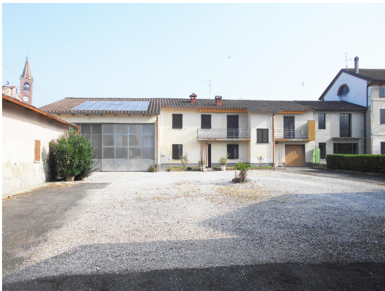
Foto 2 - Veduta del corpo nord con il deposito (a sinistra) e l'abitazione