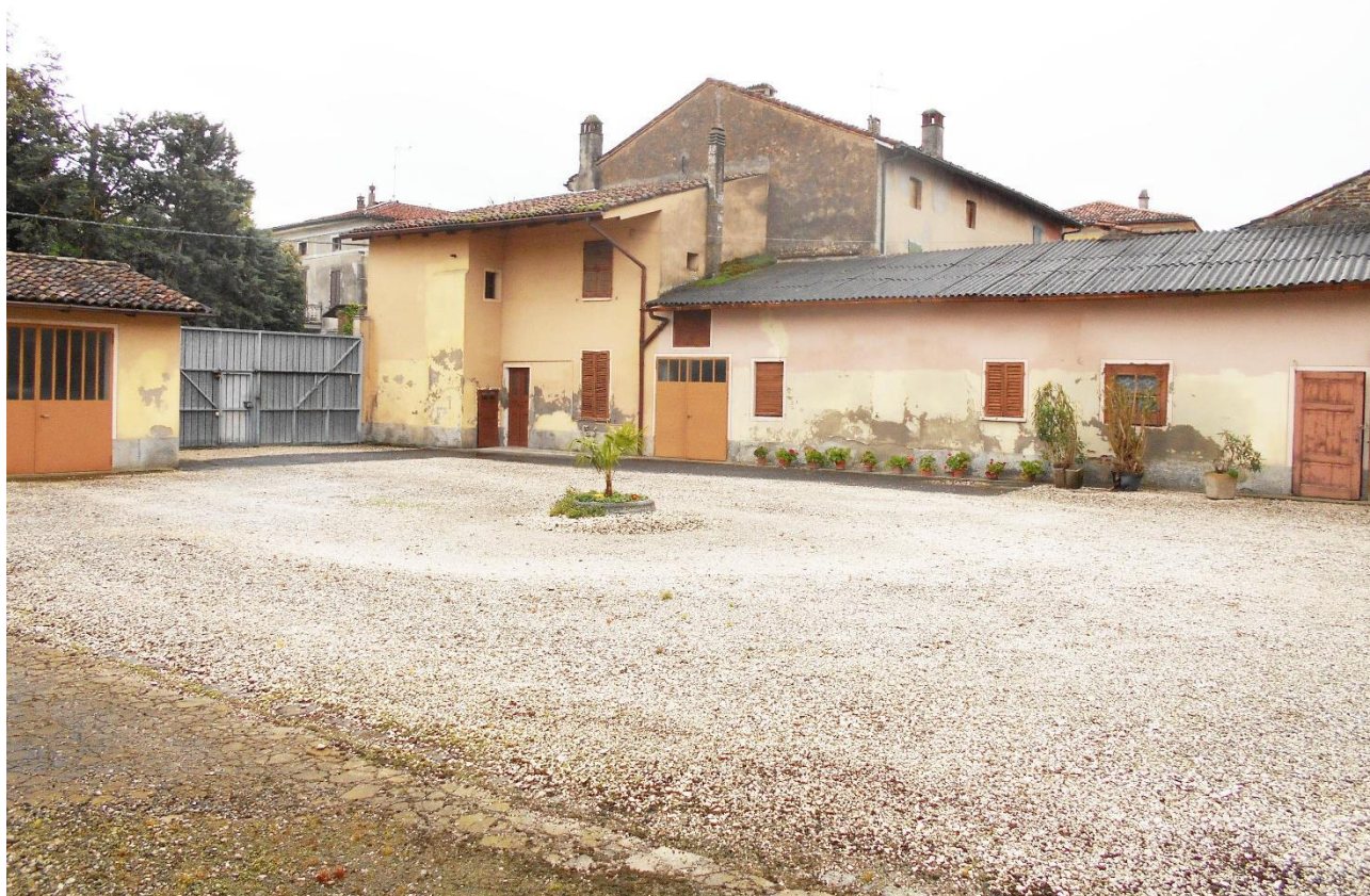
Foto 5 - Veduta del fabbricato accessorio posto sul lato ovest e del fabbricato residenziale posto sull'angolo sud-ovest (oggetto di futura demolizione)