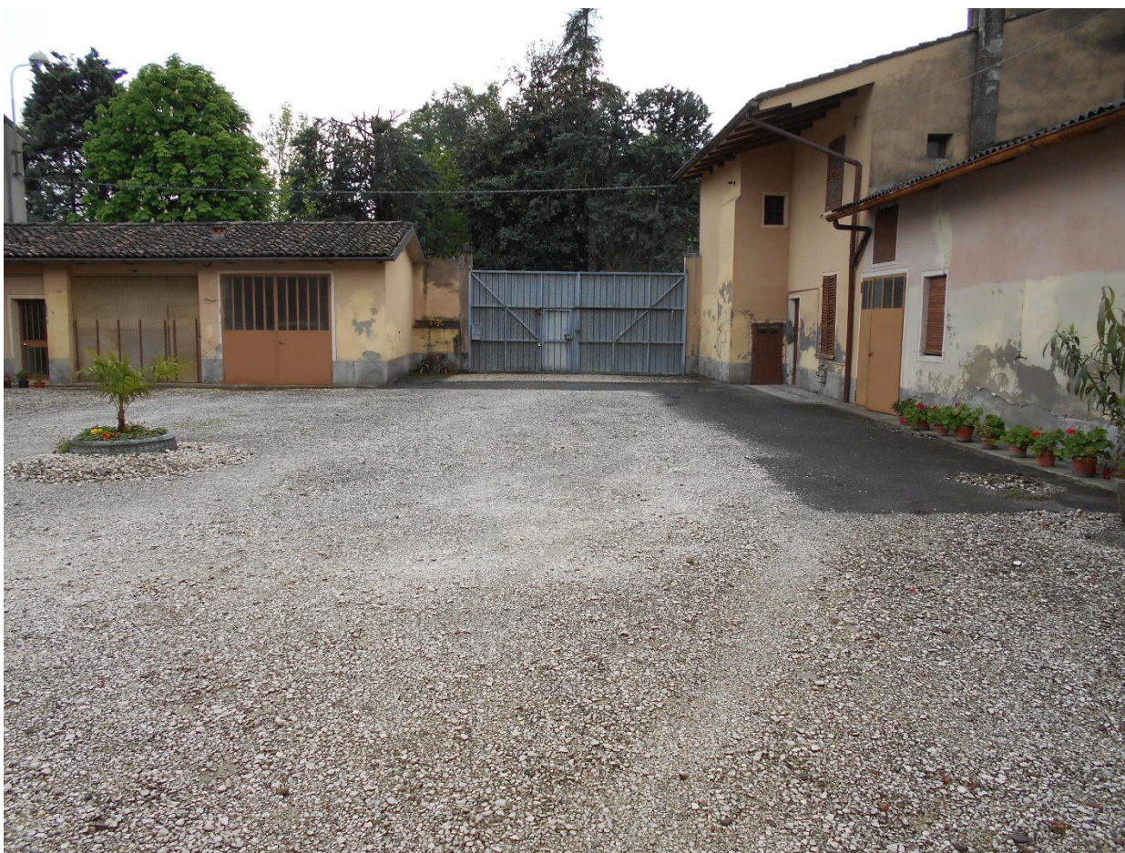
Foto 6 - Veduta dell'accesso carraio e pedonale posto su Via Della Repubblica, delle autorimesse poste sul lato sud e di parte del fabbricato accessorio (quest'ultimo oggetto di futura demolizione)