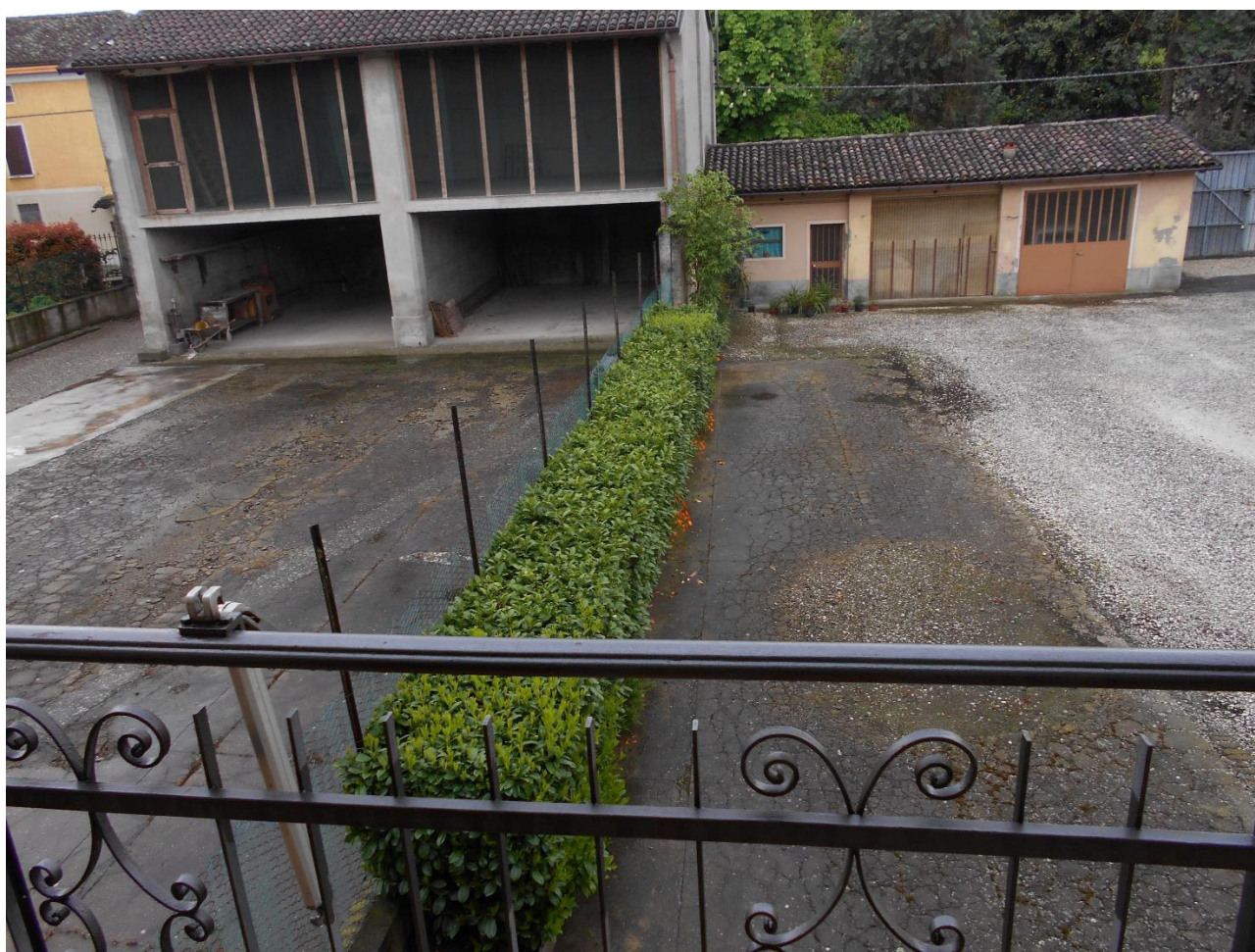
Foto 7 - Veduta del confine est tra mappale 87 (oggetto d'intervento) e mappale 318 (altra proprietà)