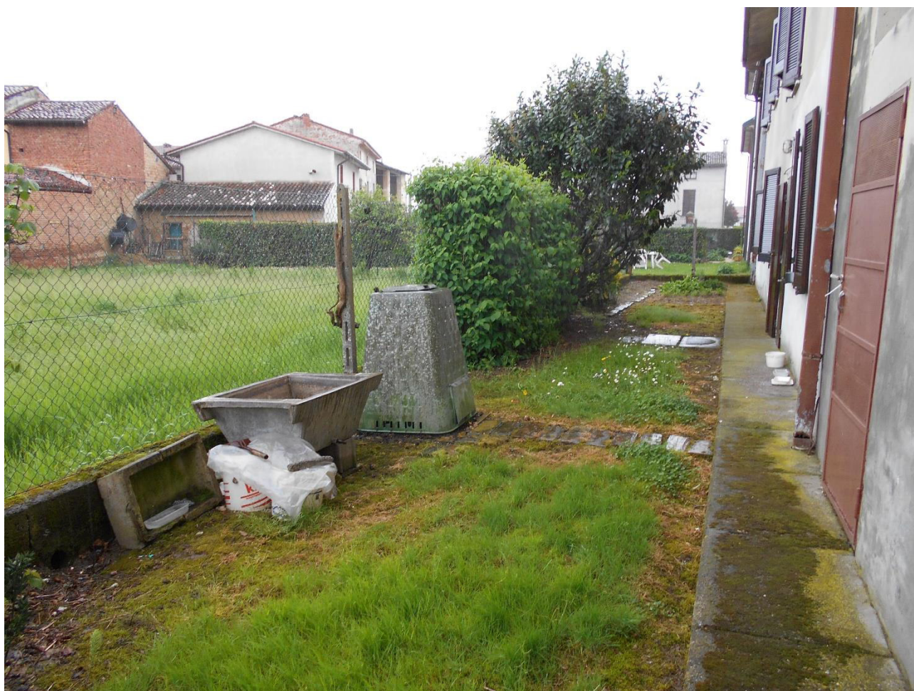
Foto 8 - Veduta del retro dell'abitazione (lato nord) e del confine tra mappale 85 (oggetto d'intervento) e mappale 221 (altra proprietà)