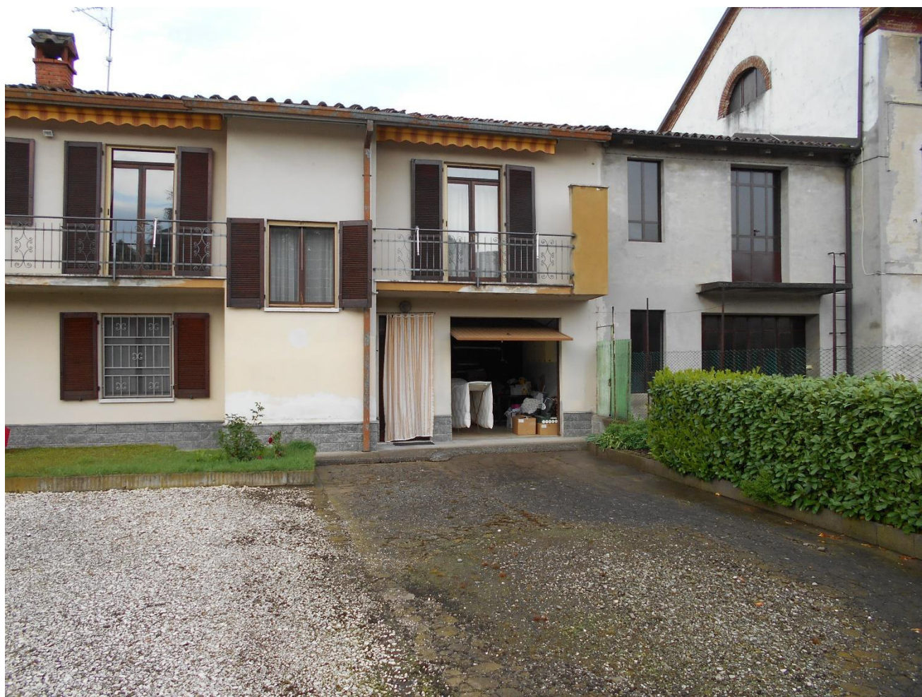
Foto 3 – Veduta di settore dell'abitazione a ridosso della proprietà limitrofa del lato est