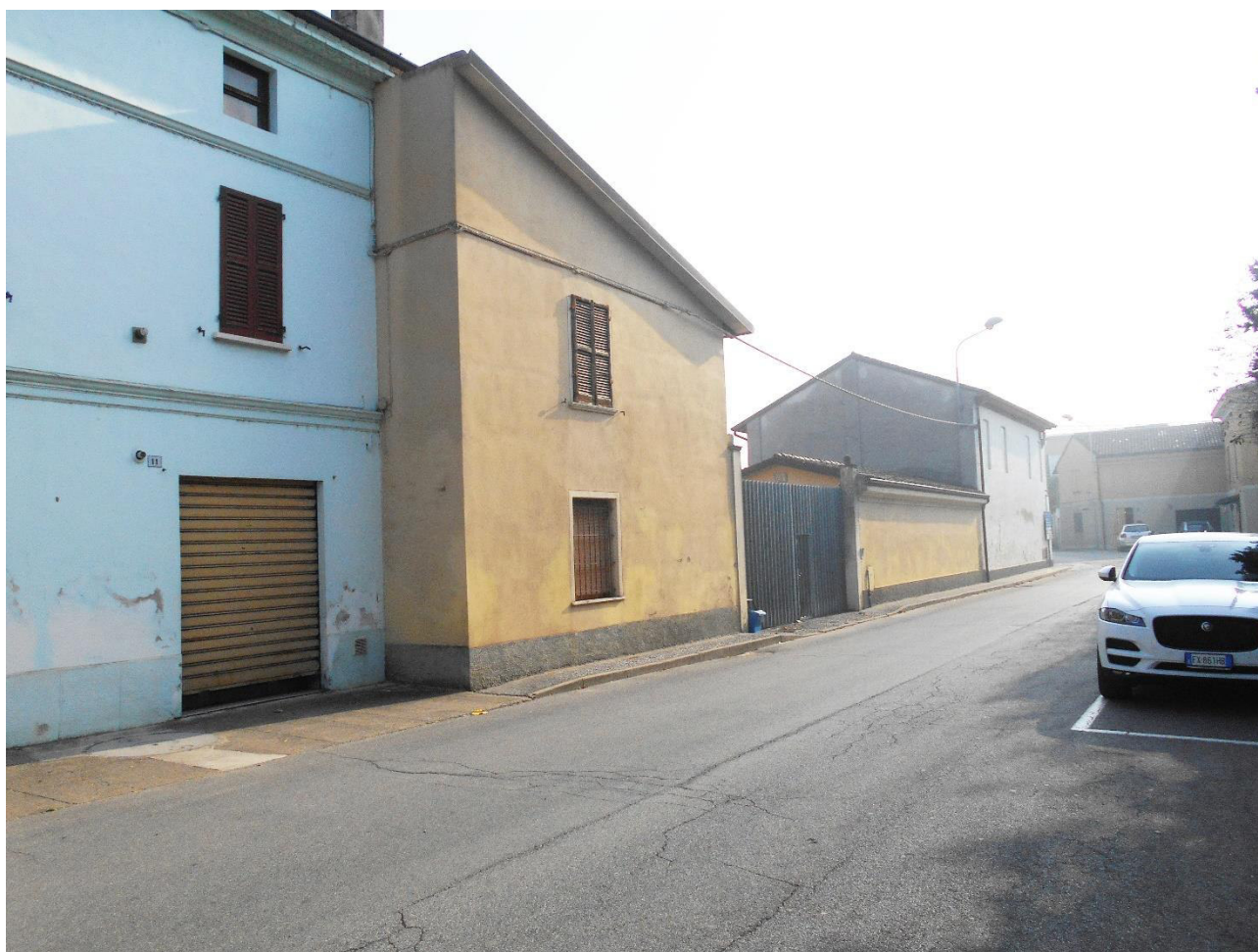
Foto 1 - Veduta dell'accesso al lotto da via Della Repubblica